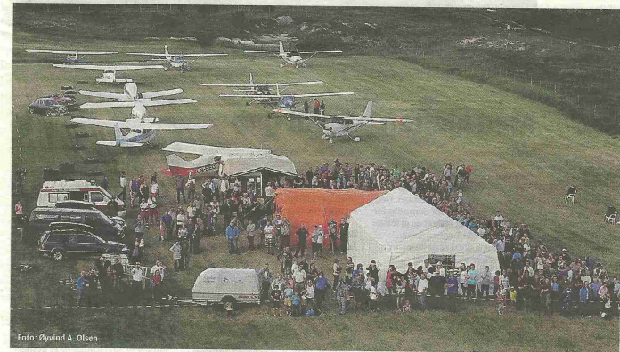
Et sprøtt innfall fra en flygal gårdbruker resulterte i at Steigen nå har fått sin egen småflyplass, 620 meter lang og 25 meter bred. Flyplassen ble offisielt

åpnet fredag kveld med besøk av 12 småfly, ett helikopter og flere hundre publikummere.